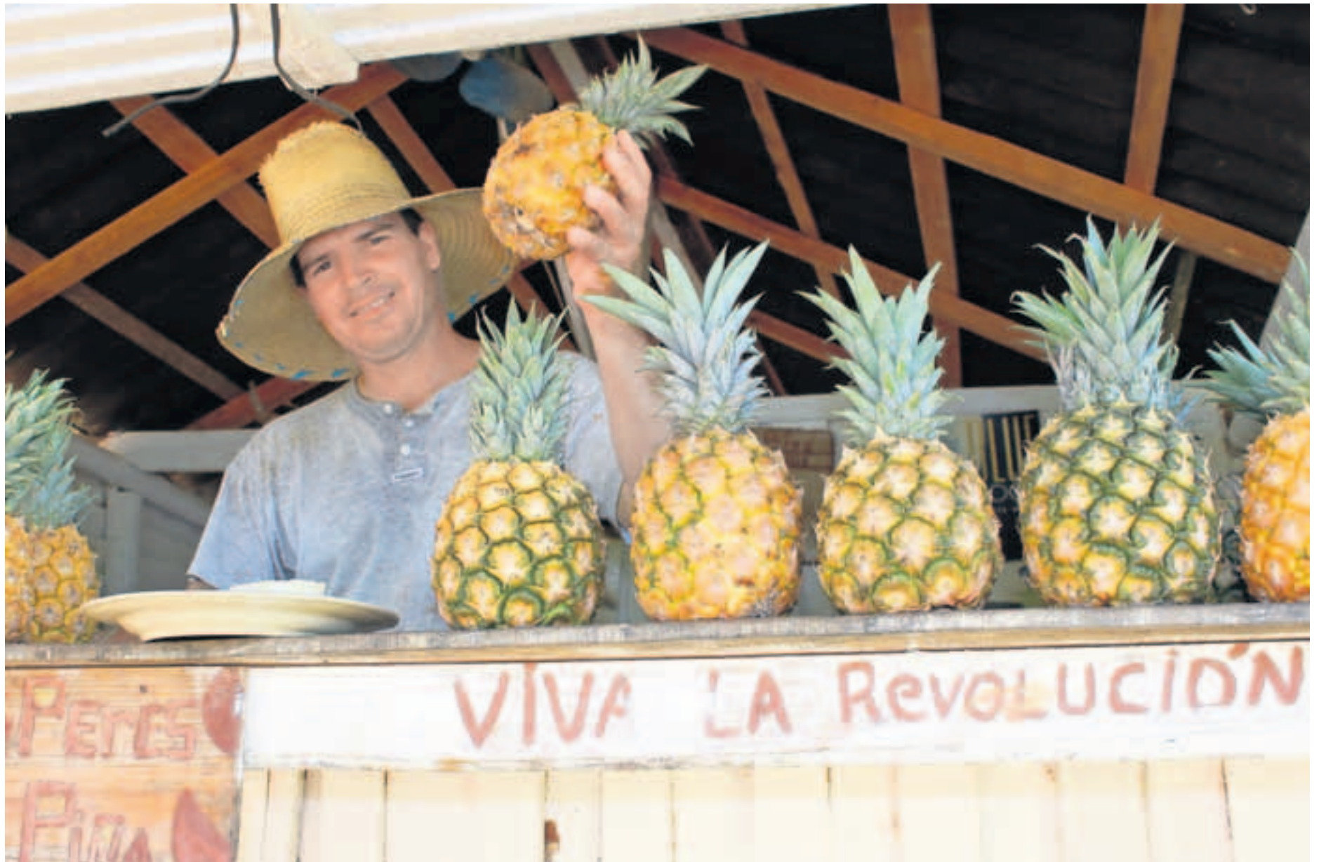
Auf eigene Rechnung. Immer schon verkauften Bauern einen Teil ihrer Produktion privat. Nun, so fordert Raúl Castro, soll das kapitalistische Marktmodell ausgedehnt werden.