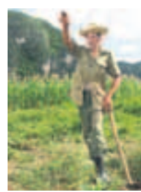
Überall wird freundlich gewunken – und gern mit den Fremden geplauscht

fiás auf einem „Campismo“ mit Betongrill und Spielplatz – den Peso cubano zahlenden Kubanern vorbehalten. Berühmt ist San Diego aber für seine Heilbäder: Schon die spanischen Kolonialherren nutzten die Heilkraft des Río San Diego mit Kureinrichtungen ab 1891. „Ay mi madre“ (ach, du liebe Güte!), möchte man beim Besuch des Kurmittelhauses mit dem Schwefelgeruch ausrufen. Das „balneario“ erscheint wie aus einem sozialistisch-stalinistischen Albtraum: Ein Tunnelgang schraubt sich immer tiefer ins Erdinnere – das Katakomben-Thermalbad hätte auch gut in die Verfilmung von „1984“ gepasst. Die Angestellten sind furchtbar nett, offenbar ist ihnen der marode Zustand ihrer düsteren Badehöhle peinlich bewusst. Dafür sind die Anwendungen spottbillig, und die Gäste scheinen zufrieden.