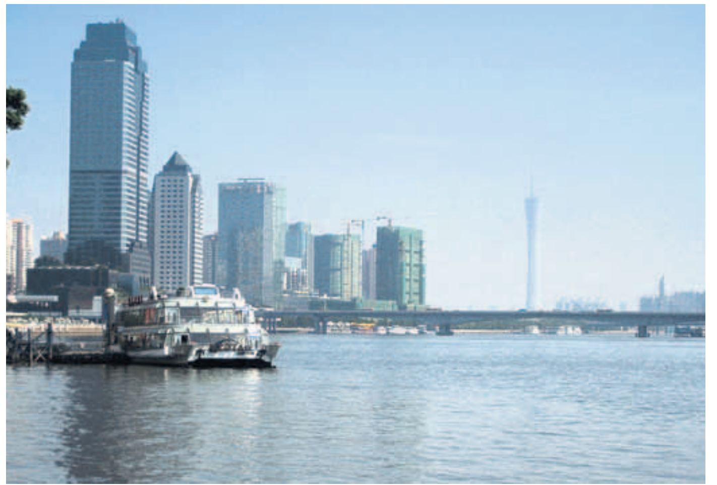
Grüner Turm. Wenn der Pearl River Tower, links im Bild, fertig ist, kann er sich komplett selbst mit Energie versorgen.

REISE: Sonntagsbeilage des Tagesspiegels. Redaktion: Gerd W. Seidemann